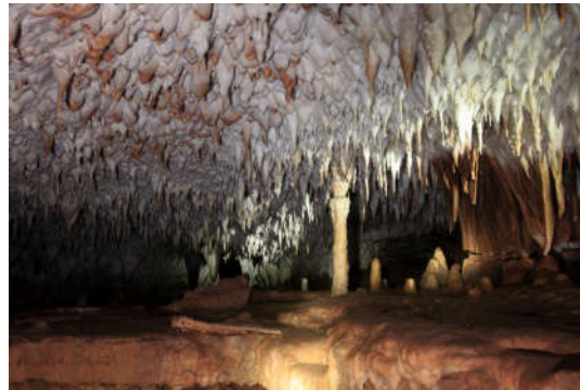
Figure 2. Cave hall

At vero eos et accusamus et iusto odio dignissimos ducimus qui blanditiis praesentium voluptatum deleniti atque corrupti quos dolores et quas molestias excepturi sint occaecati cupiditate non provident, similique sunt in culpa qui officia deserunt mollitia animi, id est laborum et dolorum fuga. Et harum quidem rerum facilis est et expedita distinctio. Nam libero tempore, cum soluta nobis est eligendi optio cumque nihil impedit quo minus id quod maxime placeat facere possimus, omnis voluptas assumenda est, omnis dolor repellendus. Temporibus autem quibusdam et aut officiis debitis aut rerum necessitatibus saepe eveniet ut et voluptates repudiandae sint et molestiae non recusandae. Itaque earum rerum hic tenetur a sapiente delectus, ut aut reiciendis voluptatibus maiores alias consequatur aut perferendis doloribus asperiores repellat.